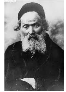
ה'חפץ חיים' (הרב ישראל מאיר הכהן מראדין)